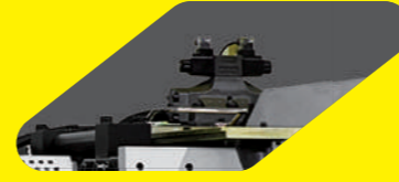
Hareketli Hazne Platformu 650 Ton' a kadar olan makinelerde hareketli, hammadde haznesi platformu