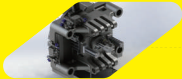
Dönme Mekanizması Döner Tabla veya Index Ünite kullanılabilir, küçük değişikliklerle birbirine dönüştürülebilir.