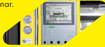
Otomatik Kontrol Avusturya menşeli KEBA kontrol grubu

Kontrol sistemi dizayn edilirken, "Bütün Uygulamalar İçin Tek Sistem" ilkesinden yola çıkılarak, çalışmalar yürütülmüştür. Bununla birlikte mekanik yapısı da, ileride ihtiyaca göre ilaveler yapılmasına izin verecek şekilde modüler olarak tasarlanmıştır.