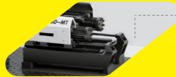
Lineer Kızak Enjeksiyon ünitesinde lineer kızaklar sayesinde hızlı ve stabil hareketler